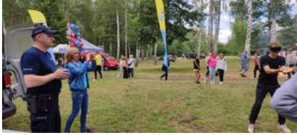
policjanci na pikniku rodzinnym