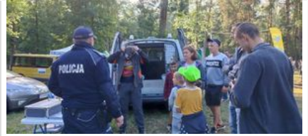
policjanci na pikniku rodzinnym