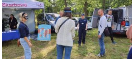
policjanci na pikniku rodzinnym